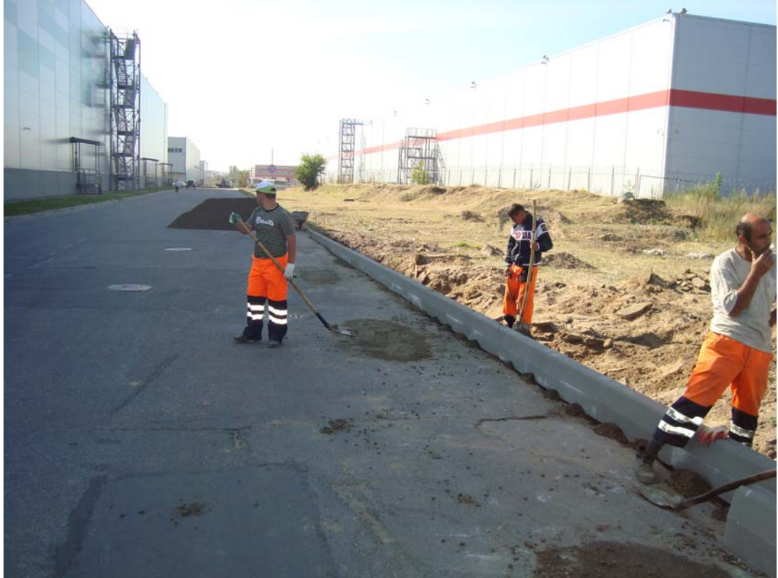
Участок: 203. Подготовка поверхности под асфальтирование: выравнивание нижнего слоя путем фрезерования