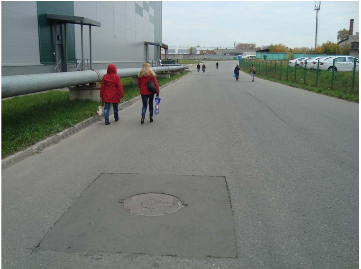
Участок :210. Колодец ливнестока. Ремонтные работы завершены