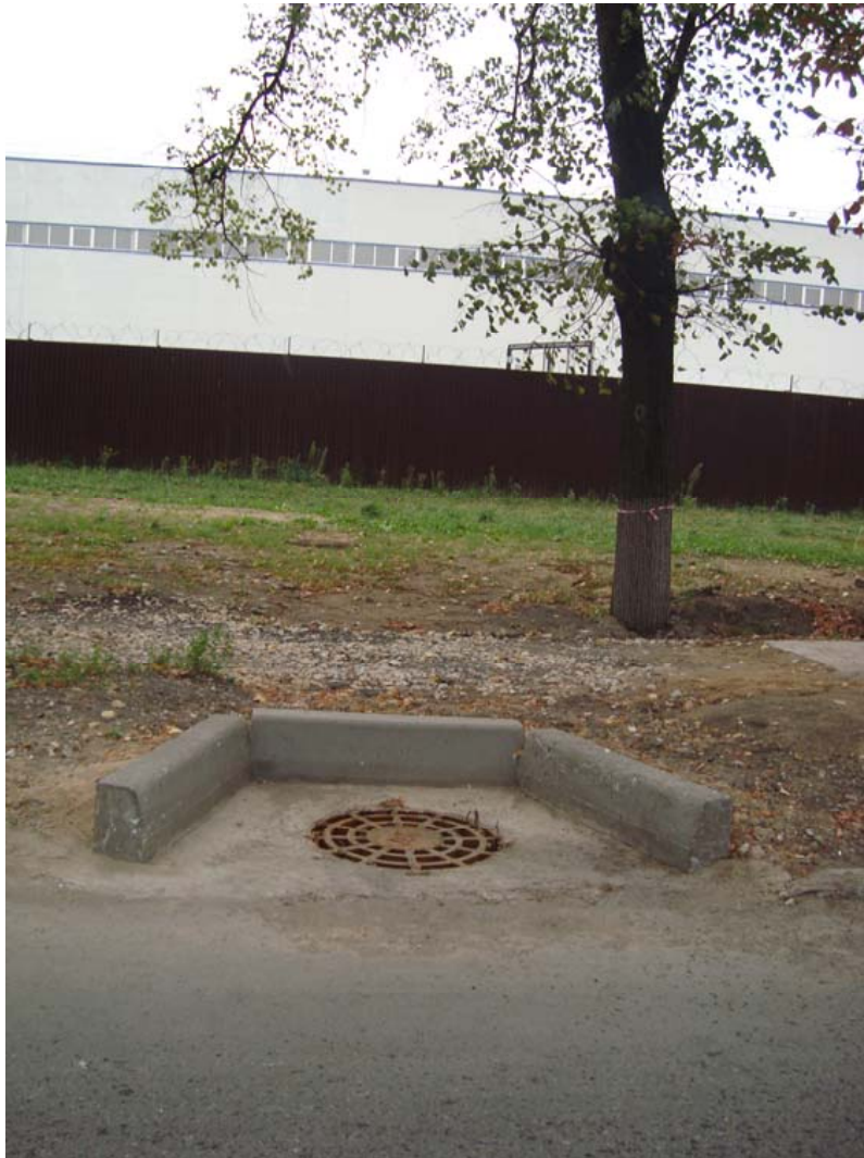
Окончание работ. Засыпка траншеи и асфальтирование