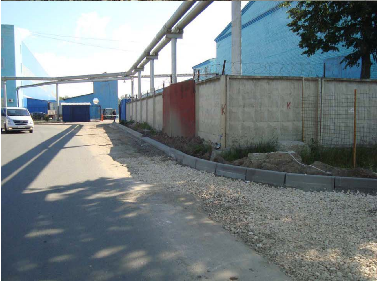
Участок :287 и :241.Выполнены работы по монтажу бордюра и устройству выравнивающих слоёв из щебня.