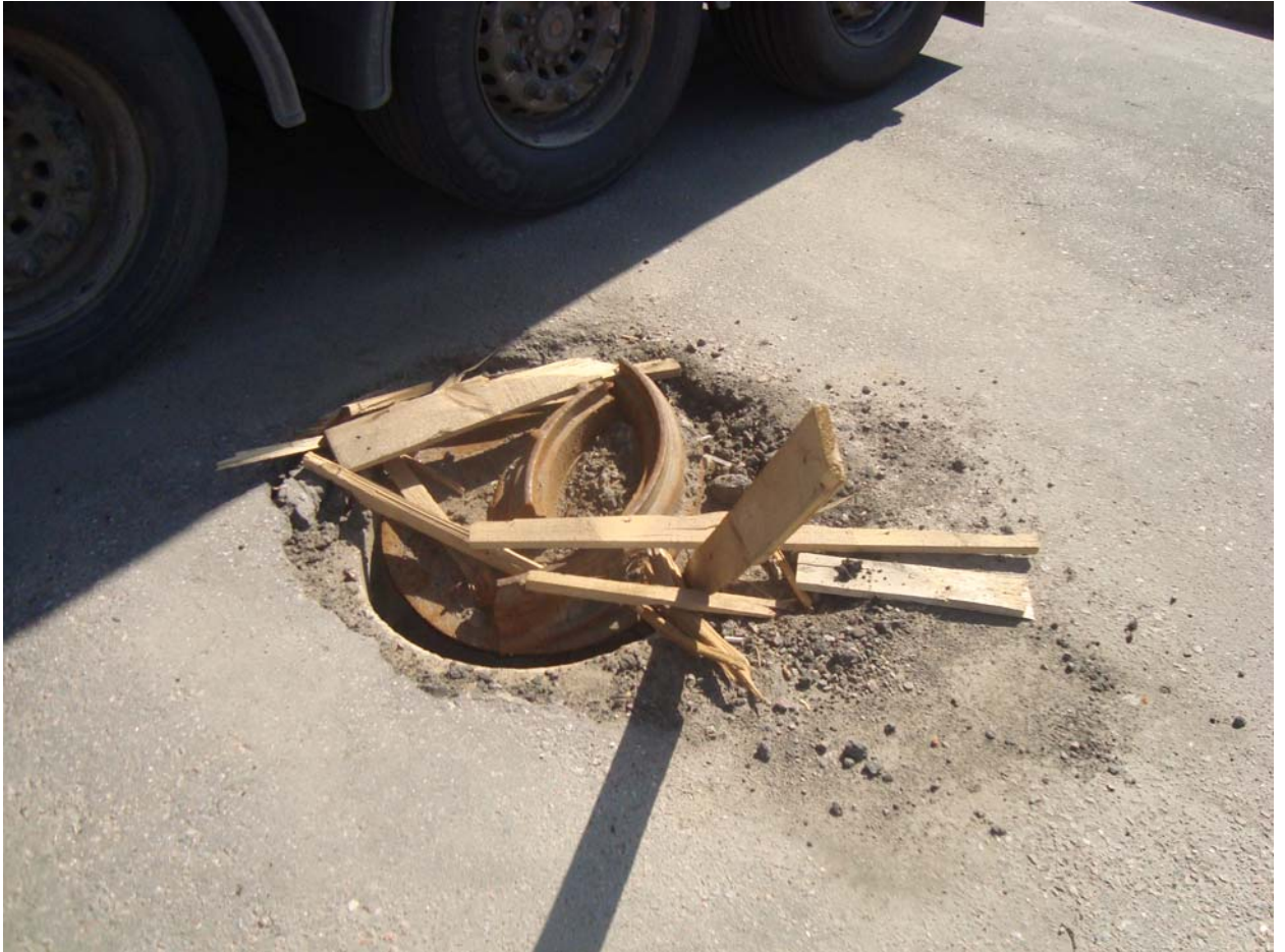
Участок: 287 (торец К-46)