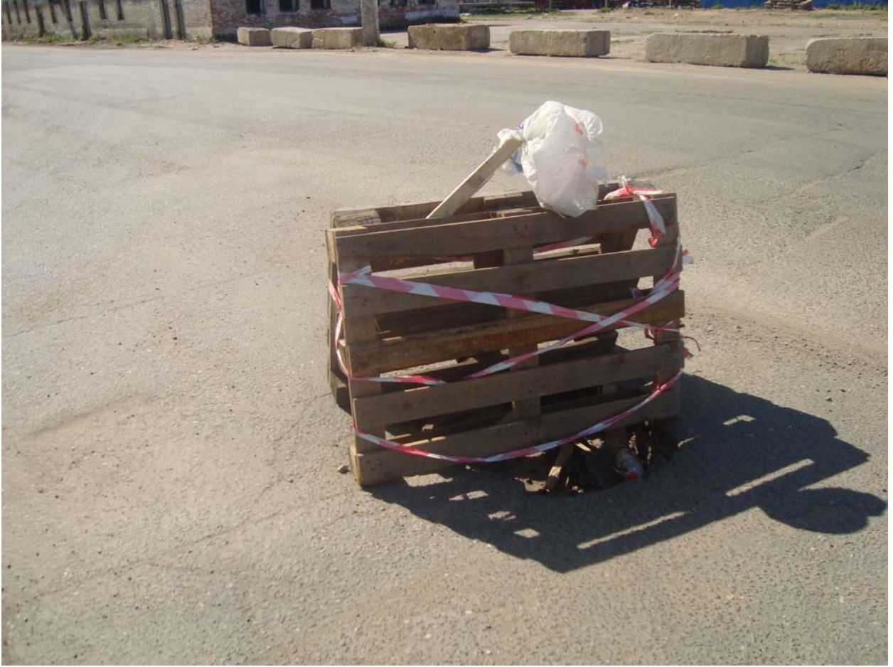
Участок: 287 (перекресток К-8 и ООО «Рика»)