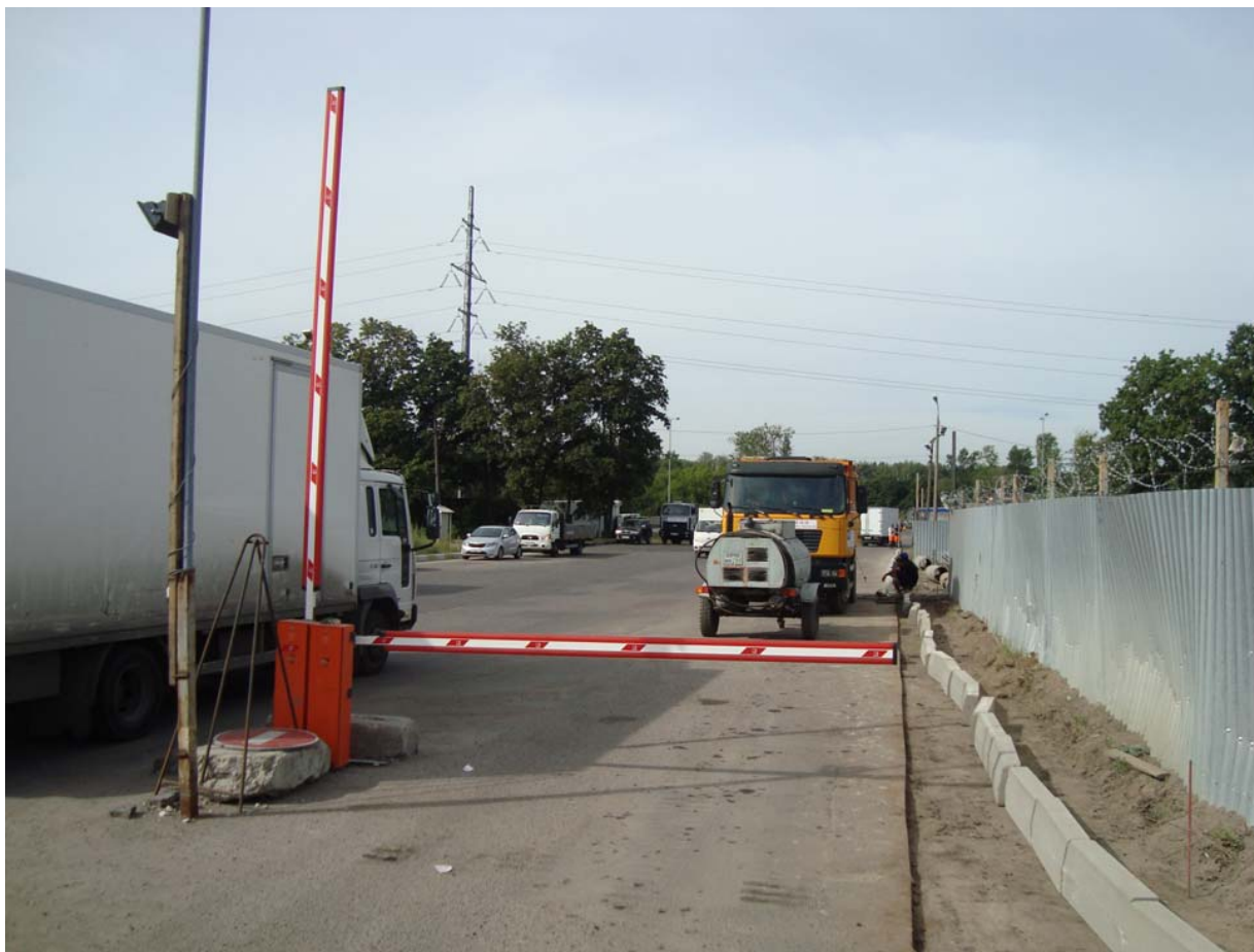
Участок :242. Монтаж бордюрного камня по всей длине дороги. Выполнение плавного закругления.