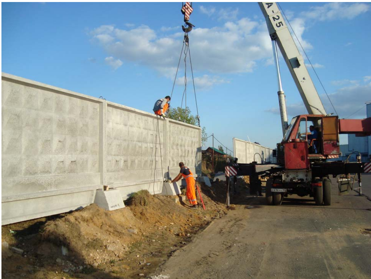
Участок :210 и :213 начаты работы по монтажу нового капитального забора.