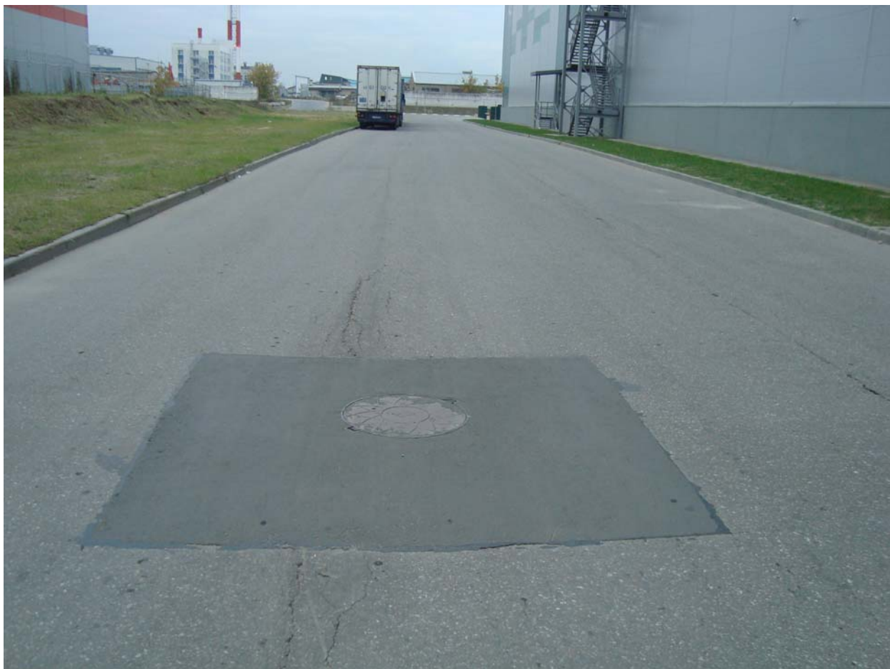
Участок :203. Колодец с запорной арматурой пожарного водопровода