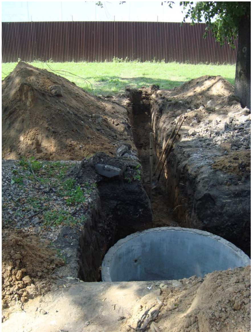
17.07.2014г. Производство работ. Разработка траншеи трубопровода ливнестока