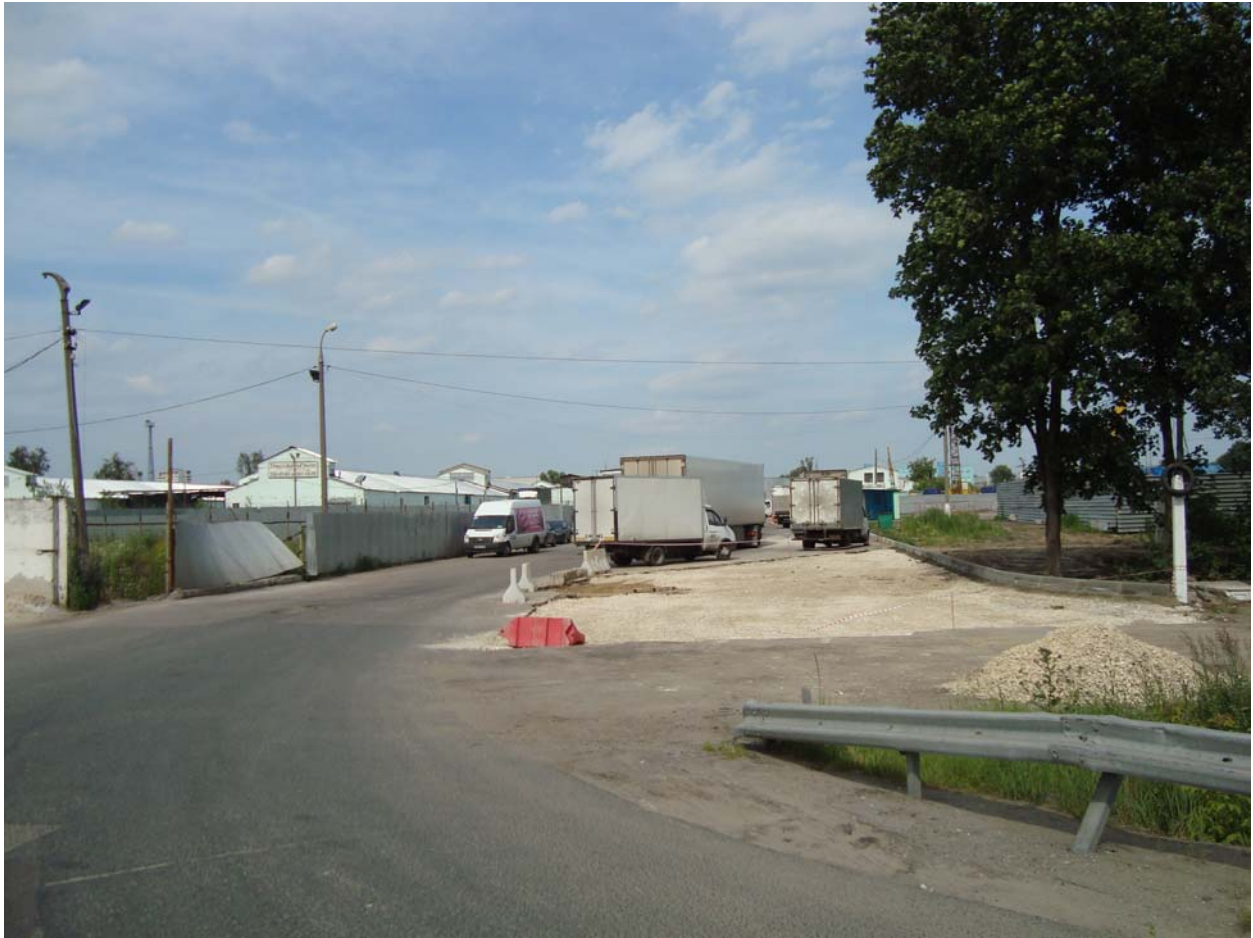
КПП №5 Вид со стороны Новорязанского ш.