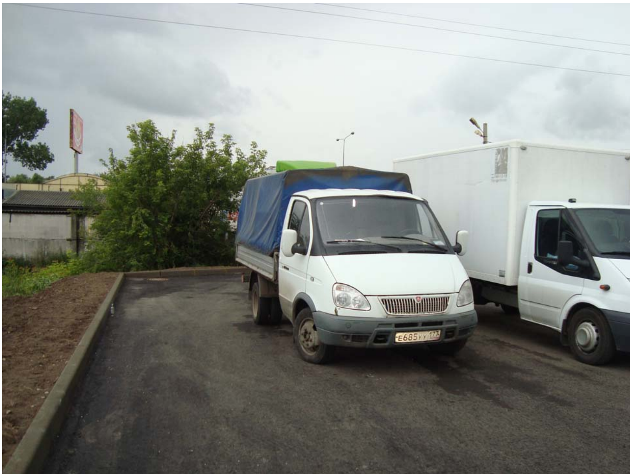
Участок :230. КПП №6. Выполняются работы по устройству магистрального отбойника