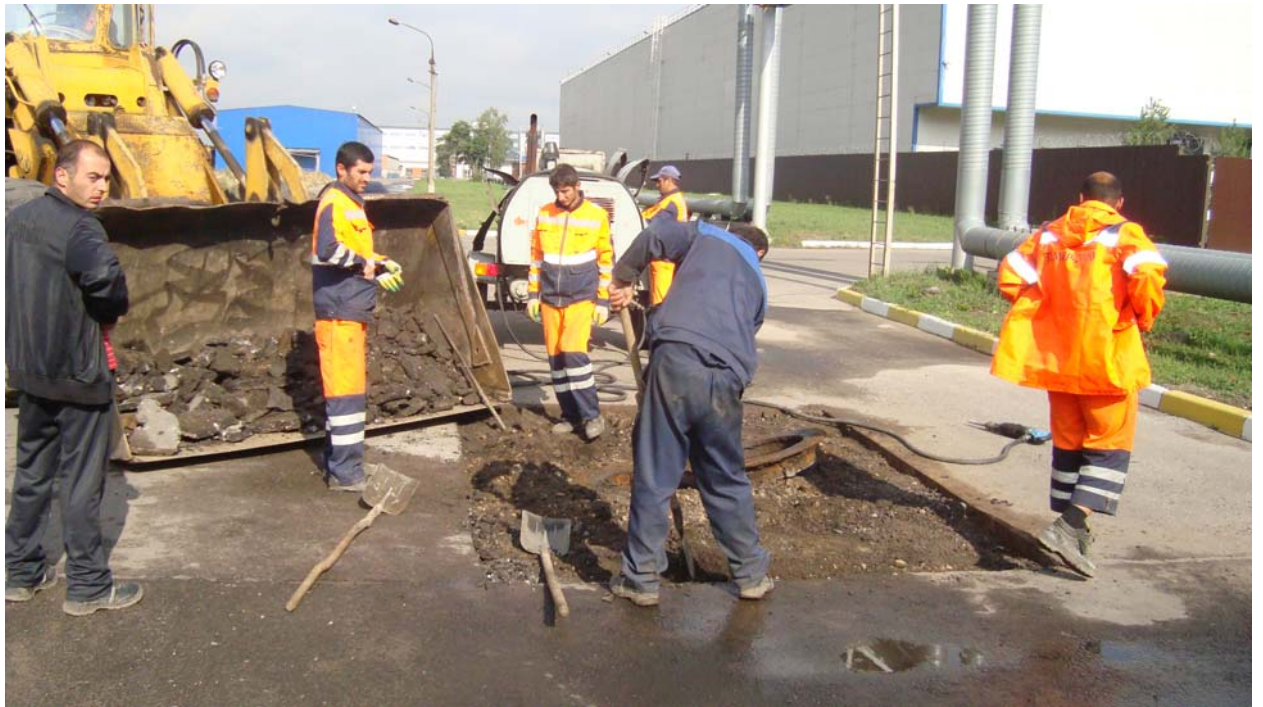
Участок: 287 (перекресток К-8 и ООО «Рика»)